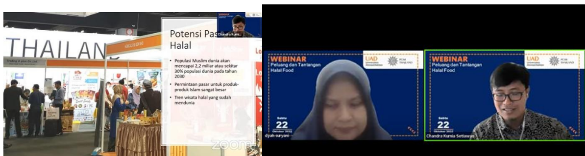
Gambar 1. Dokumentasi kegiatan webinar

Pengabdian kepada Masyarakat (PkM) Internasional bekerja sama dengan PCIM Thailand telah dilaksanakan secara daring/online. Diawali dengan koordinasi dari pihak FKM UAD maupun dengan mitra. Dari hasil koordinasi disepakati adanya webinar dengan topik peluang dan tantangan makanan halal : Studi kasus Thailand dan Indonesia dengan peserta dari Indonesia maupun dari Thailand yang sangat antusias mengikuti agenda webinar ini.