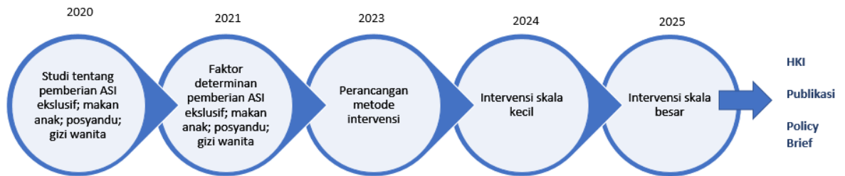
Gambar 1. Rencana Penelitian Prodi Gizi FKM UAD Bidang Gizi Masyarakat Tahun 2020-2024