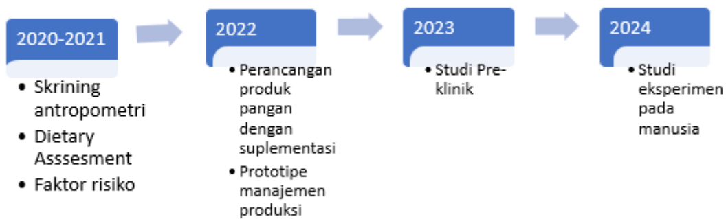
Gambar 4. Rencana Penelitian Prodi Gizi FKM UAD Bidang Metabolic Syndrome Tahun 2020-2024