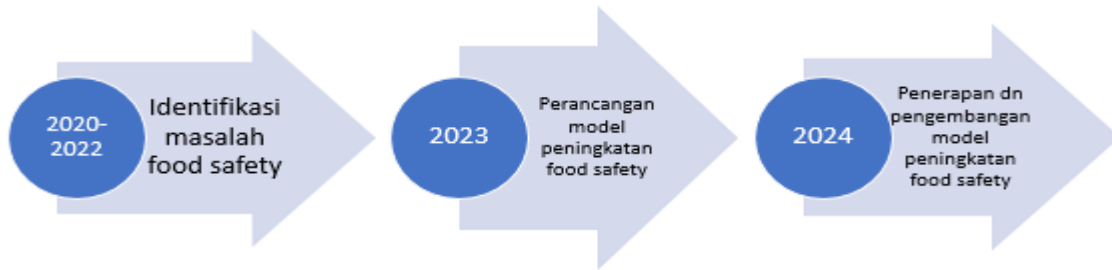
Gambar 3. Rencana Penelitian Prodi Gizi FKM UAD Bidang Safety Food Tahun 2020-2024